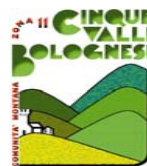
COMUNITA' MONTANA CINQUE VALLI BOLOGNESI