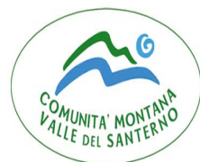
COMUNITA' MONTANA VALLE DEL SANTERNO