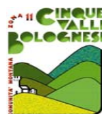
COMUNITA' MONTANA CINQUE VALLI BOLOGNESI