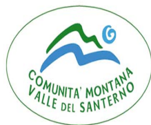
COMUNITA' MONTANA VALLE DEL SANTERNO