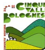
COMUNITA' MONTANA CINQUE VALLI BOLOGNESI