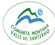
COMUNITA' MONTANA VALLE DEL SANTERNO