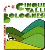
COMUNITA' MONTANA CINQUE VALLI BOLOGNESI