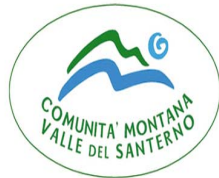
COMUNITA' MONTANA VALLE DEL SANTERNO