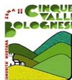
COMUNITA' MONTANA CINQUE VALLI BOLOGNESI